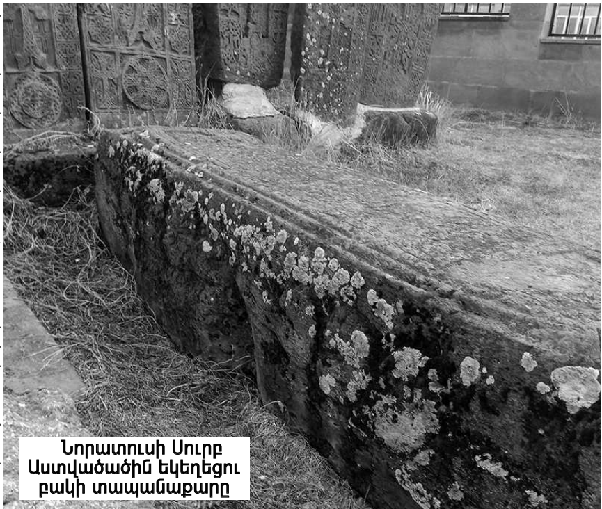
Նորատուսի Սուրբ Աստվածածին եկեղեցու բակի տապանաքարը