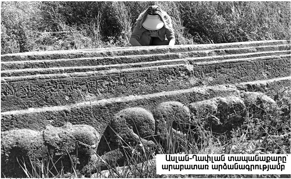
Ասլան-Ղափլան տապանաքարը արաբատառ արձանագրությանը