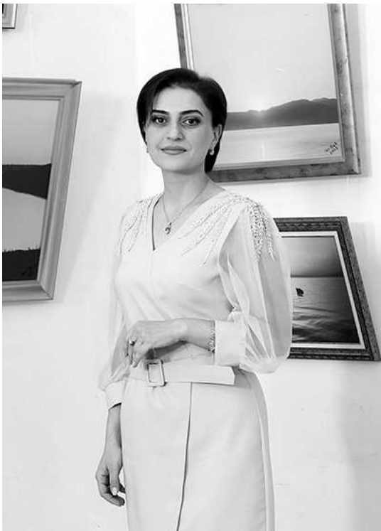
/սկիզբը՝ ախորժ համարներում/

Ալխոն գյուղի բոլոր ճանապարհները լավ գիտի, իրեն երբեմն ճանապարհ տարած ժամանակավոր տերերի հասցեները նույնպես, նա անգիր է արել նաև Ղազախի ճամփան արահետ առ արահետ, բարձունք առ բարձունք: Ալխոն ապրում է բեռնաձիու աշխատասիրությամբ, տոկունությամբ, երբեմն ինքնասպառնալիկ, սակայն լուռ ներողամտությամբ: «Լկանը պատռեց բերանը, վիզը ոլորեց ու գլուխը թեքեց, եւ Ալխոն հիմա այդպես էր գնում սարերի արահետով»: