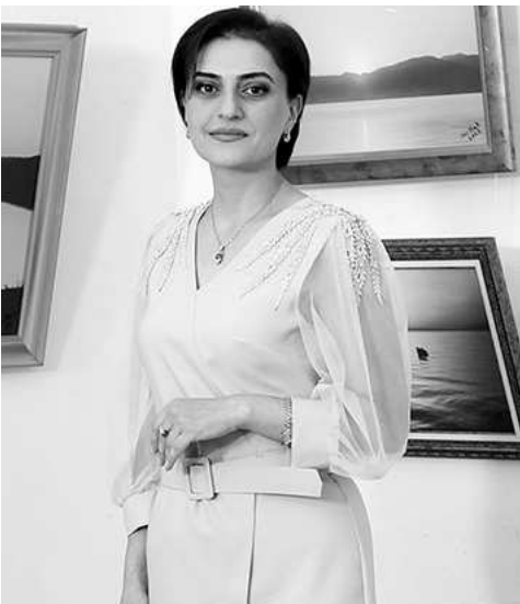
/սկիզբը՝ նախորդ համարներում/

Գործն ավարտվում է նրանով, որ կենտրոնի ստիպմամբ, անձրեւառատ եղանակին հովիվը խուզում է ամբողջ ոչխարը օրվա ընթացքում քնելով ընդամենը 4-5 ժամ: Մթերման խնդիրները հարթվում են՝ առաջ գնալով «յոթ մղոնանոց քայլերով», նախագահը կուսակցական նկատողություն է ստանում, իսկ ոչխարի «մատղաշը քարվում է»: