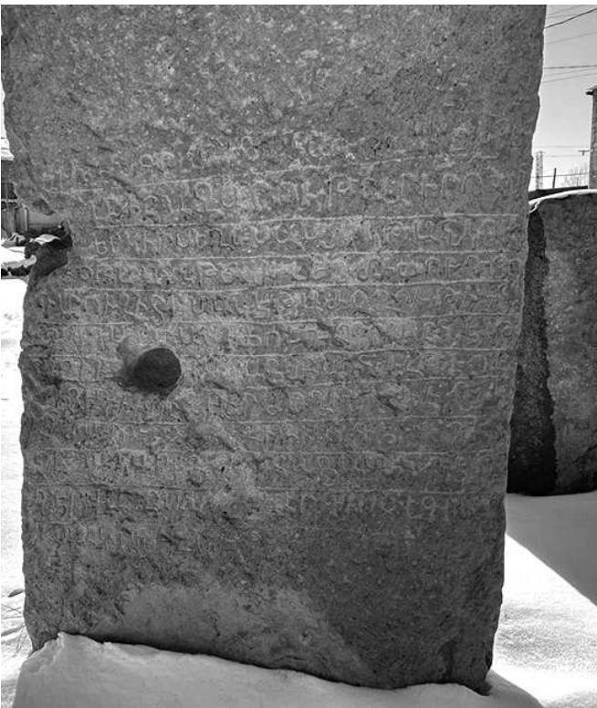
Ասկիզբը՝ էջ 1-ում/

Սակայն ամենասովորական աչքով էլ խաչքարի քիչուներին ու ճակատի ներքին հատվածում նկատելի է արձանագրությունը, ընդ որում, գծված 12 տողերի վրա, որին Բարխուդարյանն ընդհանրապես չի անդրադարձել: Ամենայն հավանականությամբ, ոչ թե հնագետը չի նկատել արձանագրությունը, այլ տեքստին կարելիություն չի տվել ելնելով խաչքարի կերտման ու արձանագրության կազմման դարաշրջանների խիստ անհամատեղելիությունից: