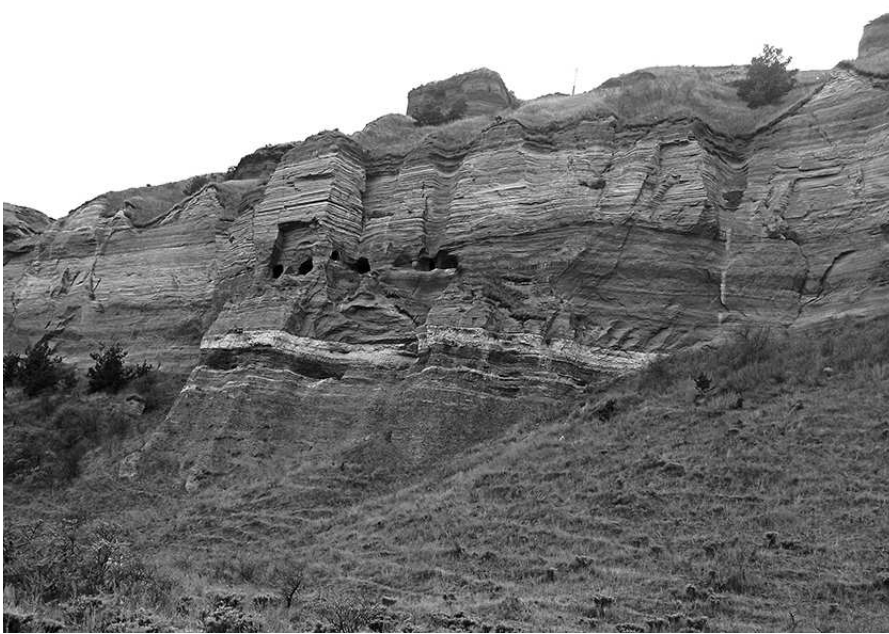
Նսկիզբը էջ 1-ում/

Պարսպի ընդհանուր երկարությունը շուրջ 500 մետր է, իսկ ամրոցի բռնած մակերեսը շուրջ չորս հեկտար: Պարսպներից ներս երեւում են կացարանների ավերակները, որոնց մեջ իր լավ պահպանությամբ աչքի է ընկնում մի քառանկյունի շենք, որի պատերը մնում են երկու-երեք շարք քարի բարձրությամբ: Պատերի լայնությունը 2,5 մետր է, իսկ շինության չորս անկյուններում դրված են խոշոր քարեր: Այս շենքն ունի երկու բաժանմունք՝ երկու սենյակի ձևով: