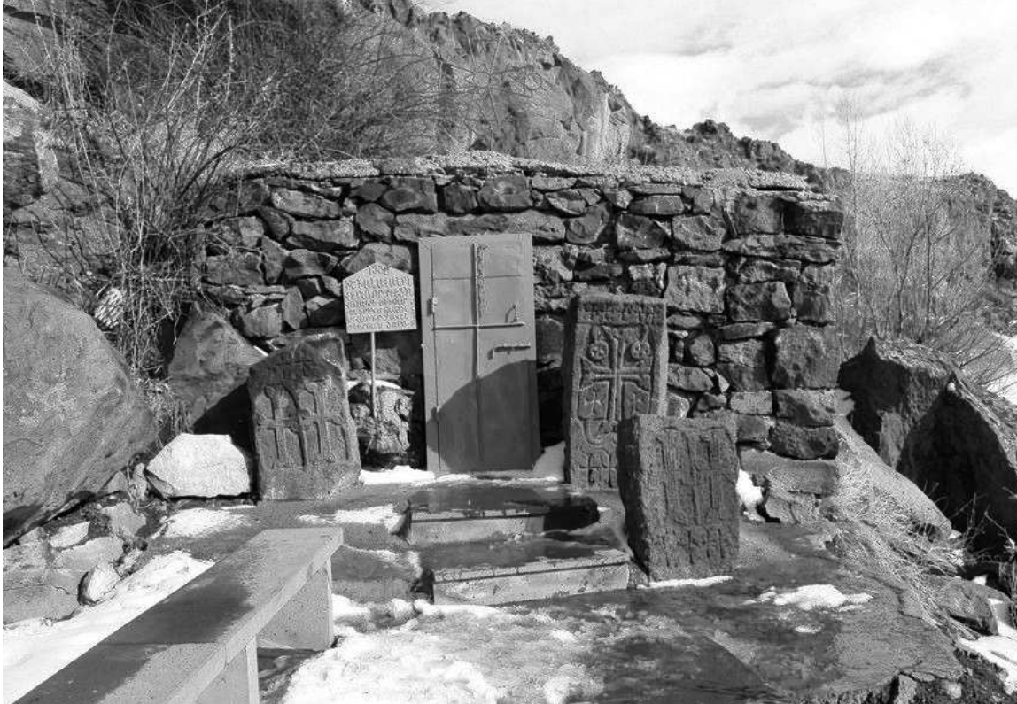
Նսկիզը՝ էջ 1-ում/

Վանքի հարեանությունը ու տարածքում պահպանվել են միջնադարյան հարյուրավոր խաչքարեր ու տապանաքարեր: Վանքի հատկապես հարավային կողմում մինչև Ագրիճի կիրճի աջափնյա հարթափերը, հեռվից էլ տեսանելի են միջնադարյան այդ կոթողները, որոնց մեծ մասն արվեստի սքանչելի գործեր են: